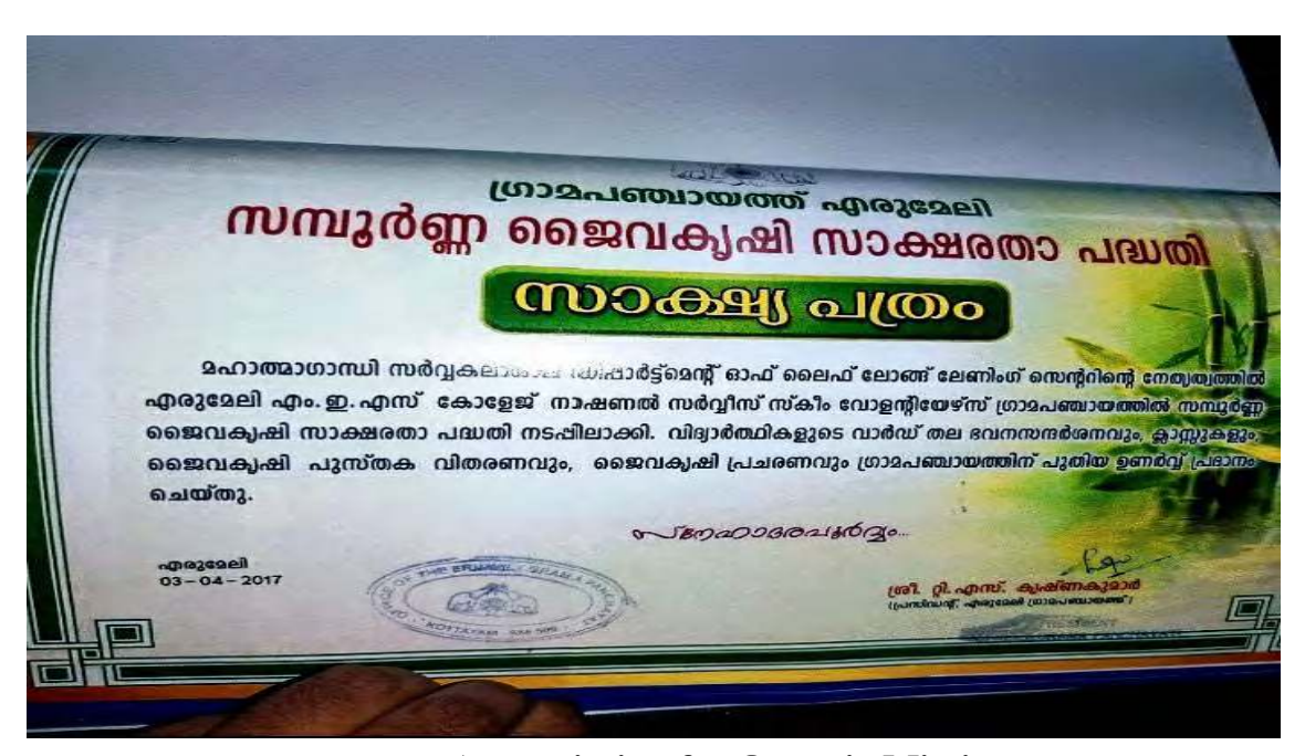
Appreciation for Organic Mission