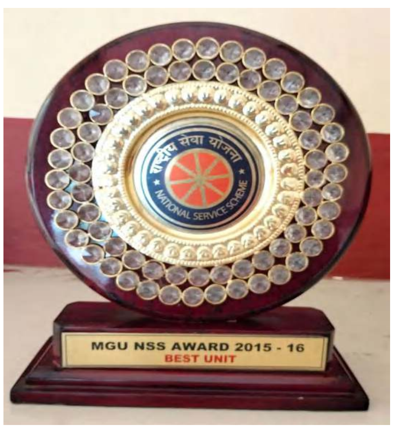
MGU Best NSS Unit Award