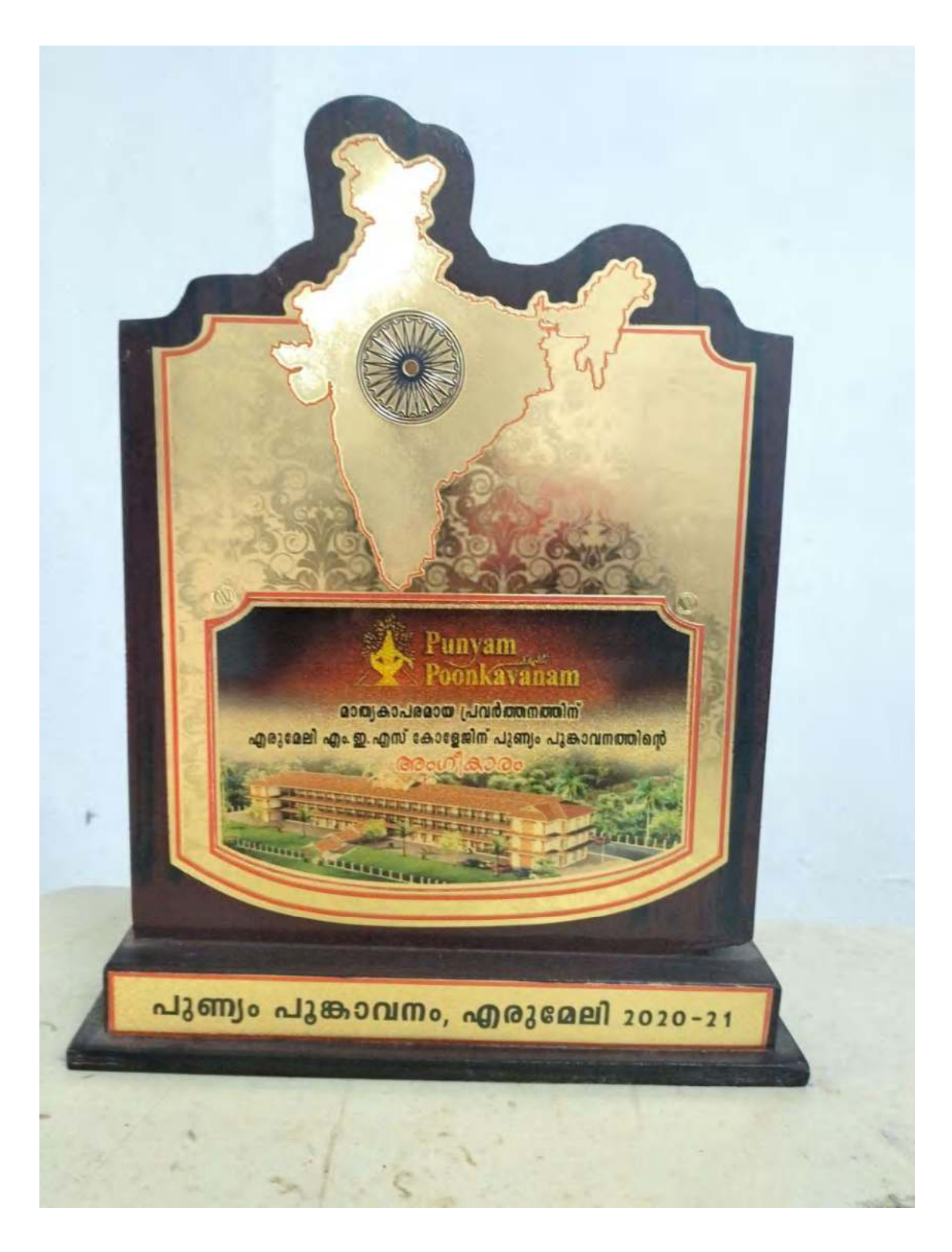
Memento for Participation in Punyam Poonkavanam Project