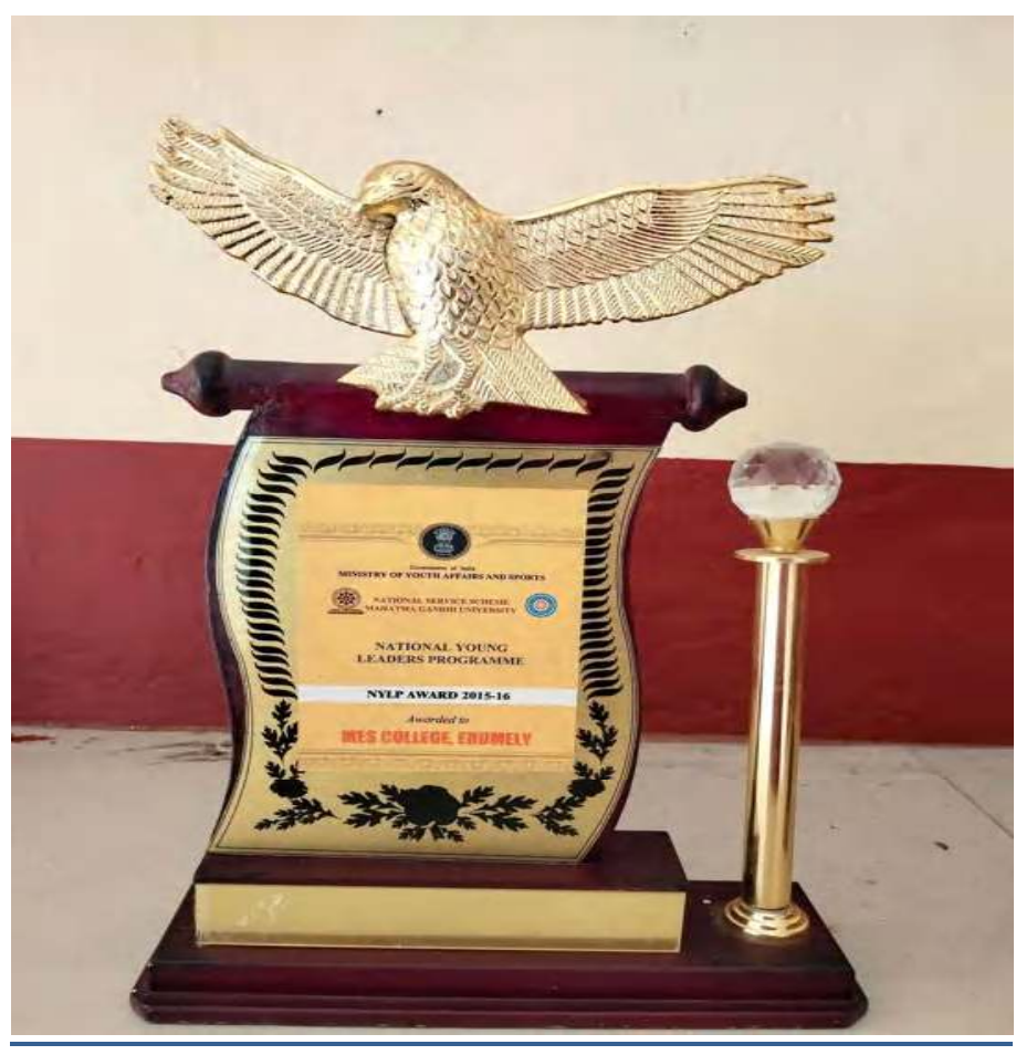
National Young Leaders Award