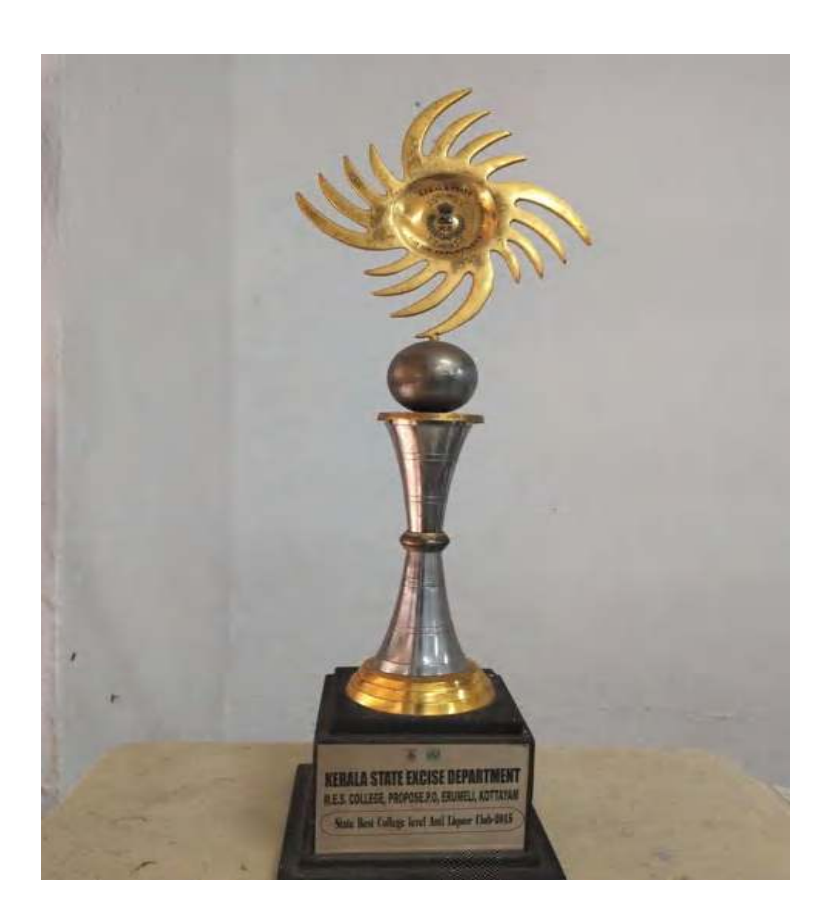
State Best College Level Anti Liquor Club from Kerala State Excise Department.