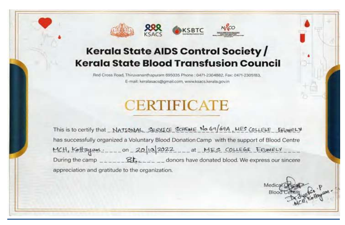
Kerala State Blood Transfusion Council (KSBTC) honoured the NSS unit